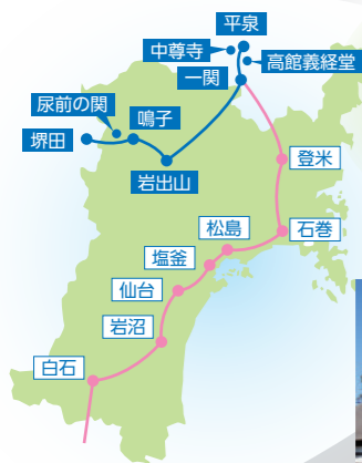
陸奥上街道 狼塚 (大崎市)