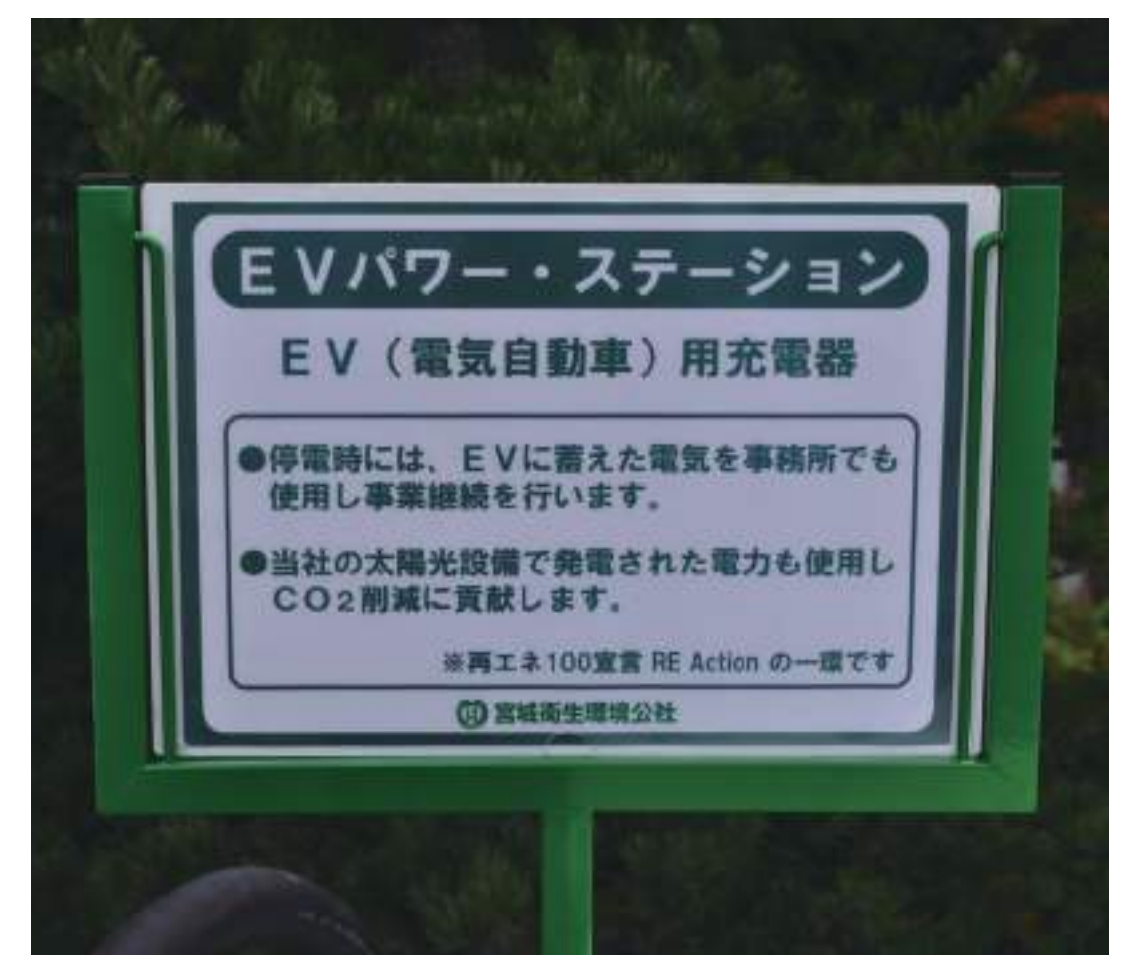
EV パワー・ステーション