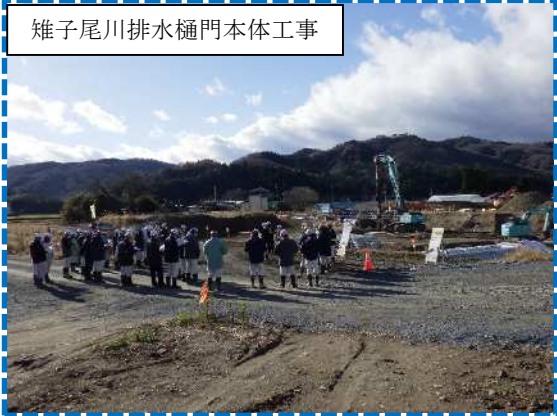
雉子尾川排水樋門本体工事