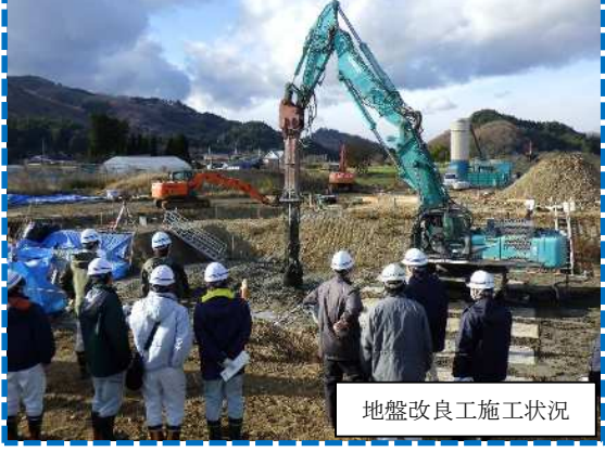
地盤改良工施工状況