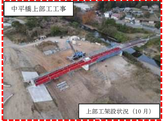
中平橋上部工工事