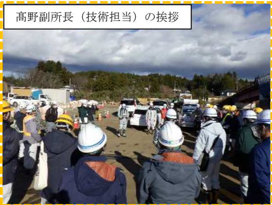
高野副所長（技術担当）の挨拶