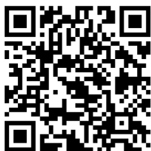
【県ホームページQRコード】

・下記アドレス又は左記QRコードで、県ホームページよりE-mailにて応募ください。