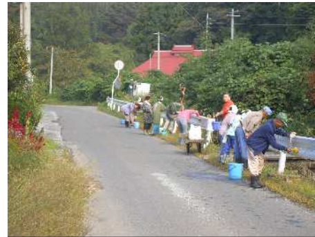
スマイルサポーターの活動状況