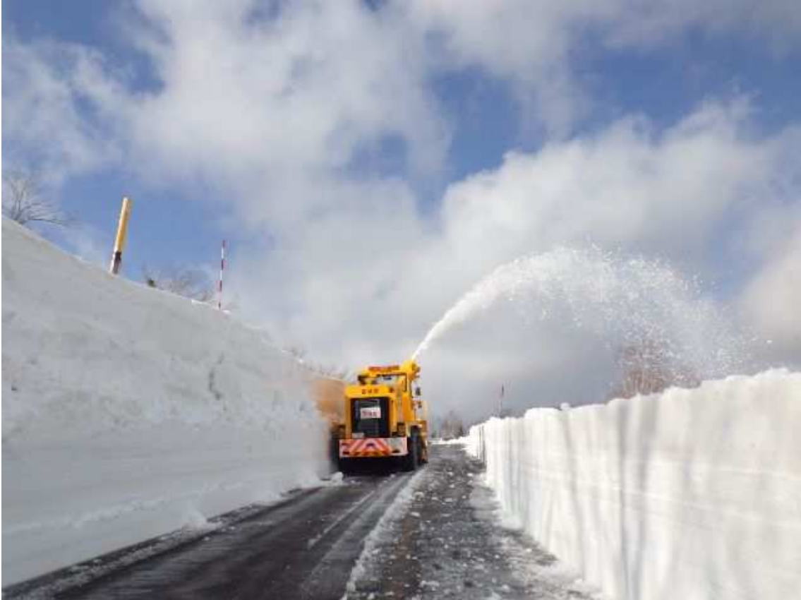
蔵王エコーライン(主要地方道 白石上山線) 除雪状況 (撮影年月日 令和5年3月14日)