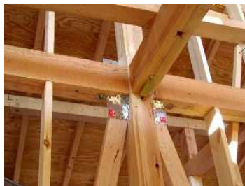
(耐震強度を確保した構造)