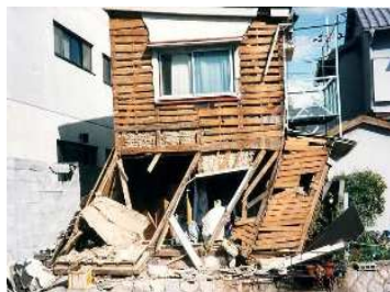
(被災した旧基準の住宅)