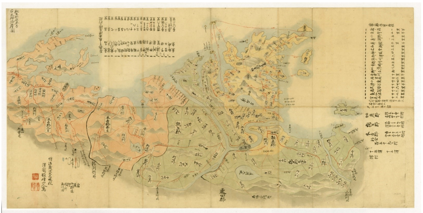
V-1208 桃生郡・牡鹿・本吉・三郡沿岸図 明治2年