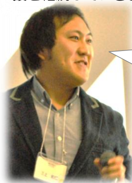
パワクロ 三上代表理事