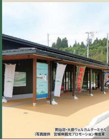
気仙沼・大島ウェルカムターミナル