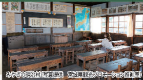
みやぎの明治村