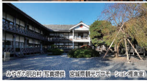
みやぎの明治村