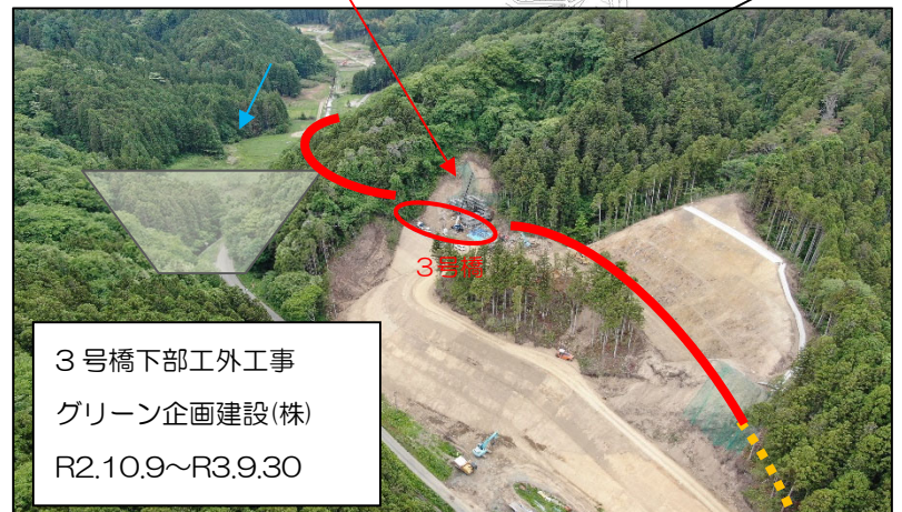
3号橋下部工外工事 グリーン企画建設(株) R2.10.9~R3.9.30 3号橋下部工・道路改良工事 (2号橋~3号橋区間)