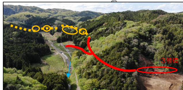
道路改良工事 (3号橋~4号橋区間~現道)