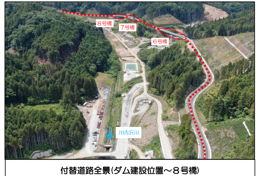
付替道路全景(ダム建設位置~8号橋)