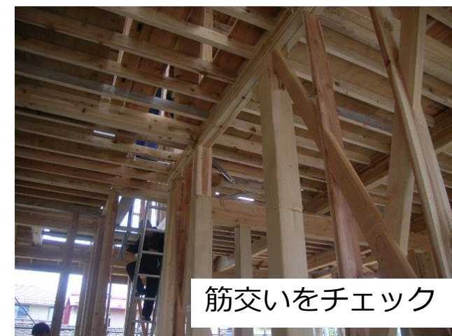
筋交いをチェック