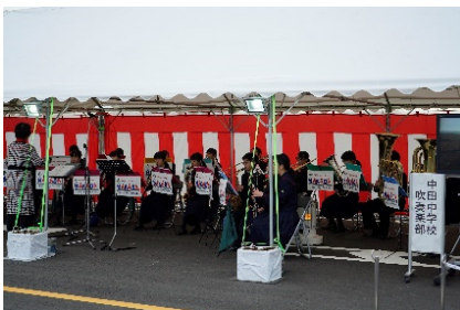
〈中田中学校吹奏楽部の演奏〉