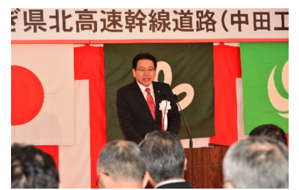
〈栗原市長 千葉健司〉