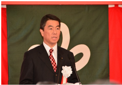
〈宮城県知事 村井嘉浩〉