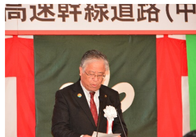
〈登米市長 熊谷盛廣〉