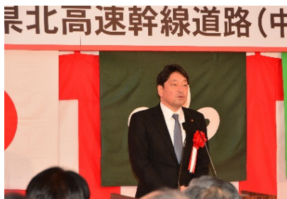
〈衆議院議員 小野寺五典 さま〉