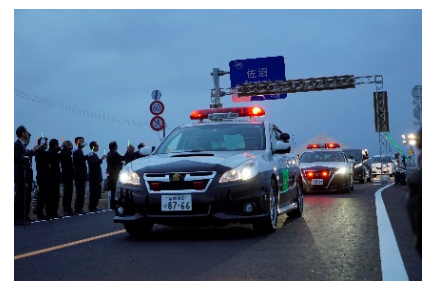
〈開通パレードの様子〉

お問い合わせはこちらまで 宮城県東部土木事務所登米地域事務所 道路建設第二班 〒987-0511 宮城県登米市迫町佐沼字西佐沼150-5 電話：0220-22-5115 E-mail：et-tmdbkk2@pref.miyagi.jp