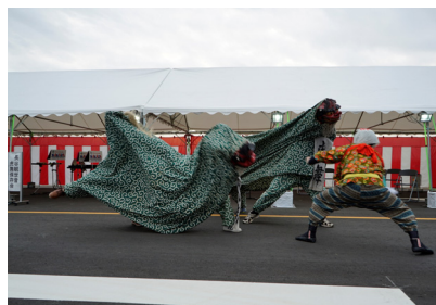
〈長谷観世音虎舞保存会による虎舞披露〉