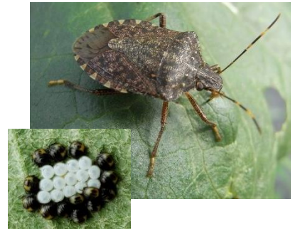
クサギカメムシ(左下:幼虫)