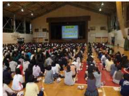
【加入阻止教室で学んだ「暴走しない させない 見に行かない」】

暴走族への人的供給を遮断するため、中・高校生を対象とした暴走族加入阻止教室を開催し、暴走族の危険性・悪質性について理解を深めさせるなど効果的な暴走族加入防止対策を推進する。