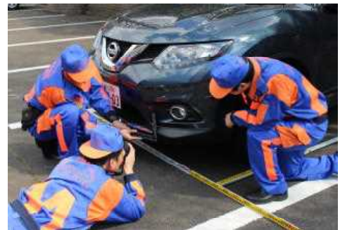
【綿密な鑑識作業を行う交通事故捜査員】

科学的な交通事故事件捜査を推進するため、各種交通鑑識資機材に加え、防犯カメラやドライブレコーダー等の映像を効果的に活用するとともに、各種資機材の整備を進める。