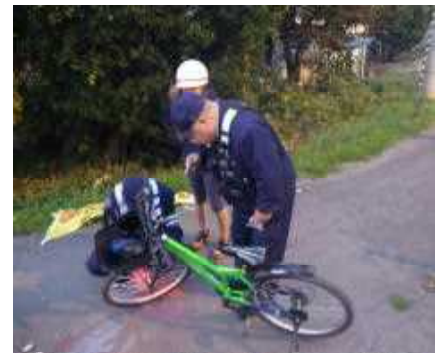
【自転車に対する普及促進】