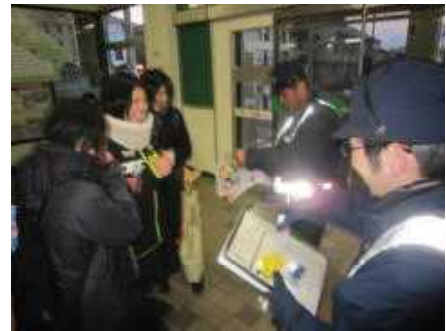
【歩行者に対する普及促進】

さらに、衣服や靴、鞆等への反射材の組み込みを推奨するとともに、適切な反射性能を有する製品についての情報提供に努める。