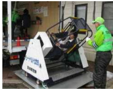
【シートベルト体験】

後部座席を含めた全ての座席におけるシートベルト着用の徹底を図るため、市町村を始めとする関係機関・団体等と連携し、各種講習等のあらゆる機会及び各種広報媒体を活用して、広報啓発を図るほか、交通指導取締りを推進する。