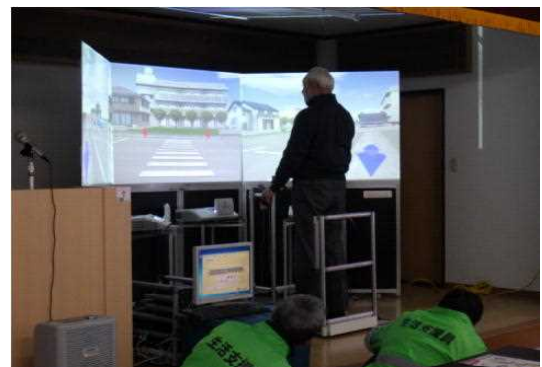
【歩行環境シミュレーターの活用】

また、高齢運転者に対しては、安全な運転に必要な技能・知識を再確認させるため、通行の態様に応じた参加・体験・実践型の講習会の実施に努めるほか、安全運転サポート車の普及に向けた広報啓発等を推進する。