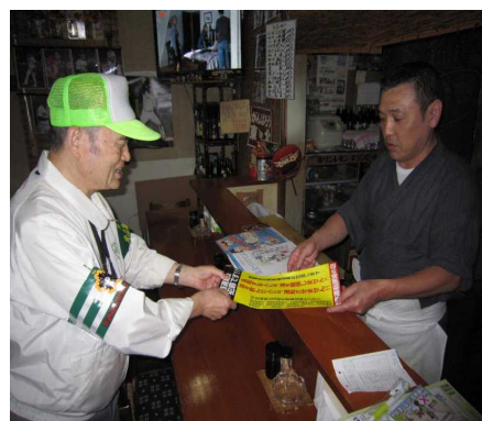
【飲酒運転根絶活動推進委員の活動】

宮城県飲酒運転根絶に関する条例（平成19年宮城県条例第86号）の制定趣旨の周知徹底を図るとともに、各種施策等を積極的に推進するほか、自治体や事業所等の再発防止対策を推進するための指導・助言を積極的に行う（飲酒運転に係る情報提供等）。