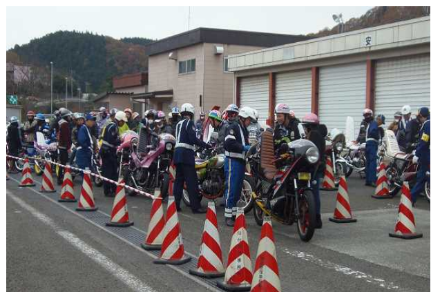
【交通秩序を乱す旧車會にはあらゆる法令を適用して検挙】

また、旧車會グループの中には、暴走族風に改造した旧型自動二輪車等を連ねて大規模な集会や走行を行うなど、迷惑性が