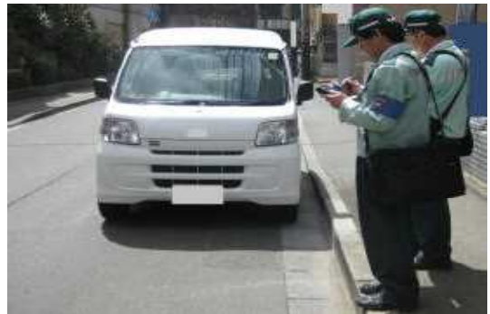
【交通の円滑化に欠かせない駐車監視員】

また、取締り活動ガイドラインについては、定期的な見直しを行い、常に警察署管内における違法駐車の実態を反映したものになるように努める。このほか、駐車監視員による放置車両の確認等に関する事務の適切かつ円滑な運用、悪質な運転者に対する責任追及の徹底、放置違反金制度による使用者責任の追及等に努めることにより、地域の駐車秩序の確立を図る。