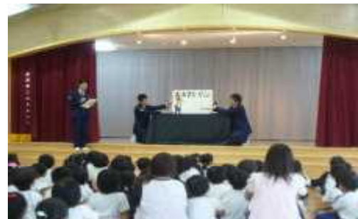
【幼児に対する交通安全教育】

幼児に対しては，交通ルールや交通マナー等，道路の安全な通行に必要な基本的な技能及び知識の習得を目的に，幼稚園，保育所，認定こども園等と連携して，紙芝居や視聴覚教材等を活用した交通安全教室等の実施に努める。