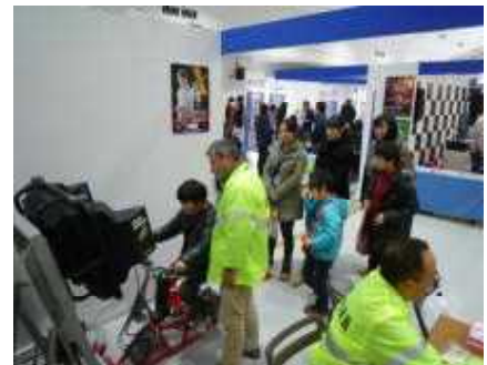
【自転車シミュレーターの活用】

学校、教育委員会、関係機関・団体等との連携を強化し、児童・生徒に対する自転車安全教育を強力に推進するとともに、自転車シミュレーターの活用等による参加・体験・実践型の自転車教室を開催するなど、教育内容の充実を図る。