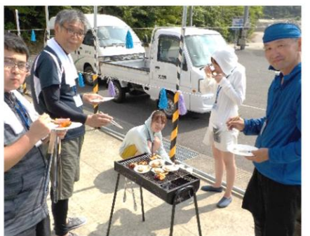
楽しくいただきました♪