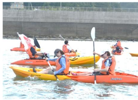
シーカヤックが漕げるようになりました。洋上で集まってイエィ！