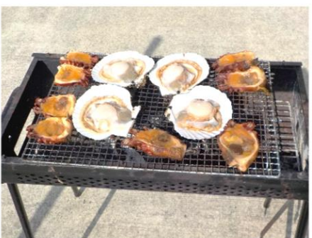
炭火でこんがり焼けました♪