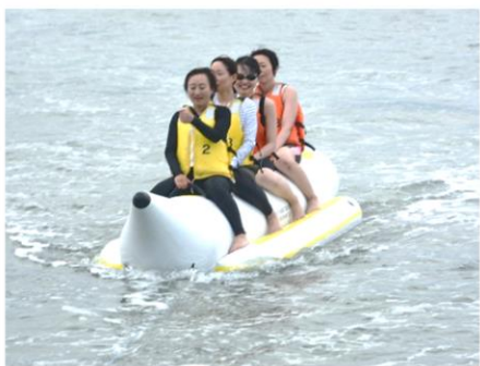
バナナボートも乗りました♪