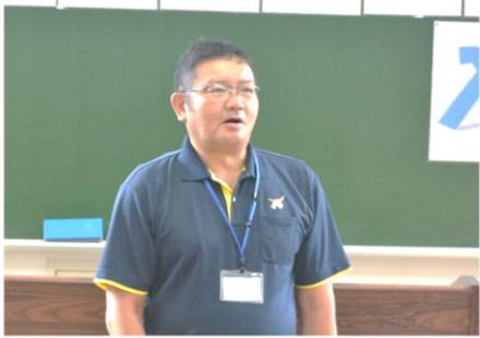
開講式 参加者代表挨拶