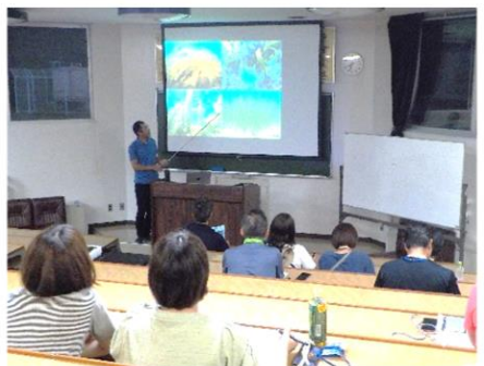
志津川湾の自然について楽しく詳しく学びました。