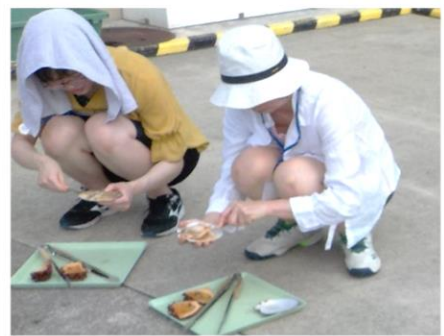
ホヤとホタテむきに挑戦！！