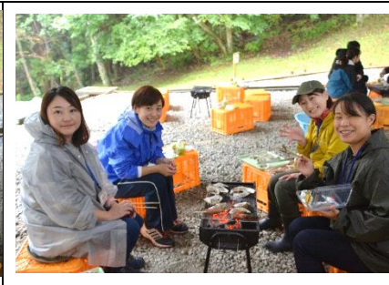
かき剥き体験・焼きがき試食