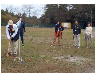
グラウンド・ゴルフ大会