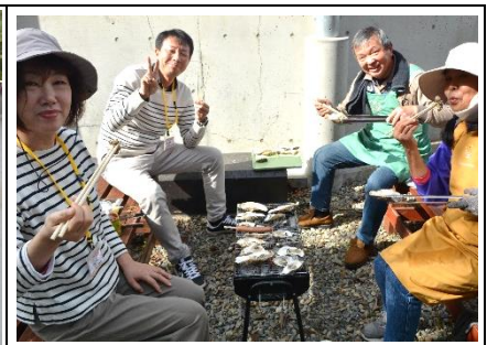
牡蠣剥き体験・焼き牡蠣試食