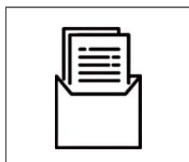
応募書類の作り方