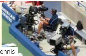
2018 US Open Tennis

当社で製造している放送カメラが2018年に開催された「US Open Tennis」で使用され、全世界で放映されました。