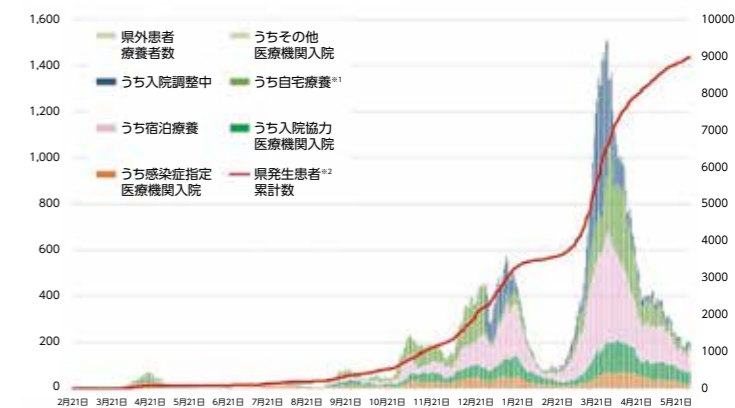
新型コロナウイルス罹患者数の推移

県内の感染状況は、3月末をピークにいったんは減少に転じましたが、4～5月の2カ月間で約1200名の新規感染者が確認されているほか、新たな変異株の発生や患者の増加による医療体制への影響など、予断を許さない状況が続いています。一人一人の心掛けが大切な人を守ることに繋がります。引き続き「手洗い」や「マスクの着用」、「3密の回避」などの基本的な感染対策、「感染リスクが高まる5つの場面および業種ごとの感染拡大予防ガイドライン等に基づく感染防止策の徹底」にご協力をお願いします。