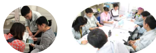
生産者間ネットワークの活動風景