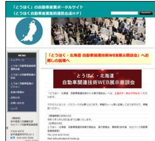
とうほく自動車産業集積連携会議HP