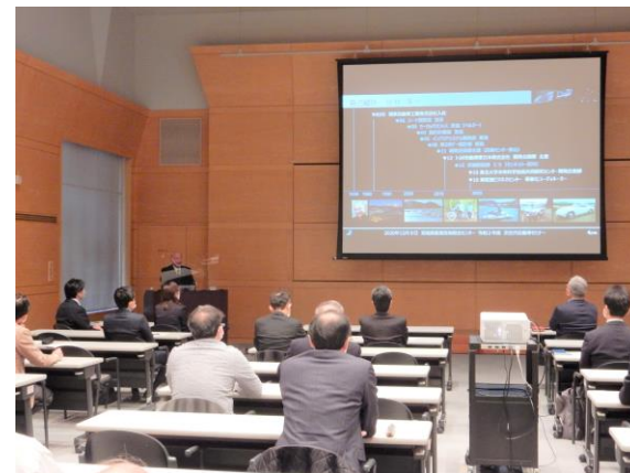
次世代自動車セミナー