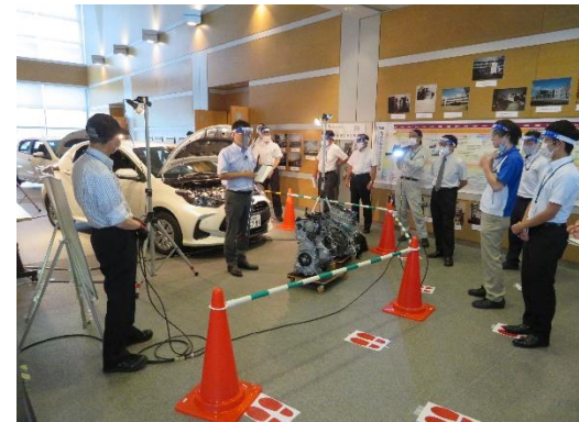
自動車の生産と新技術編