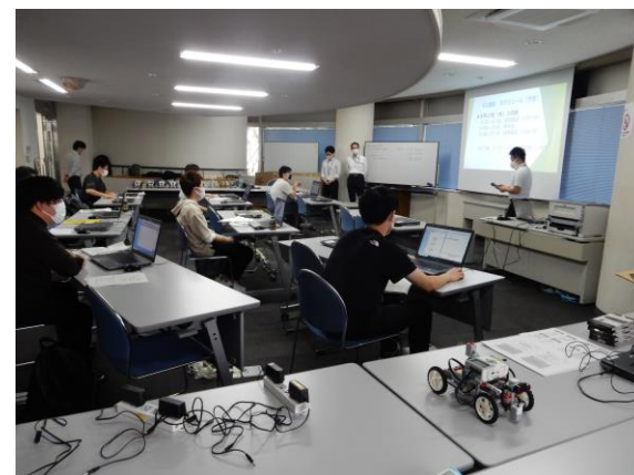
みやぎカーインテリジェント人材育成センター事業