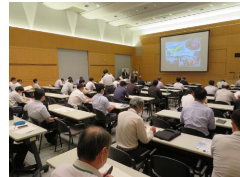
みやぎ生産改善事例発表会