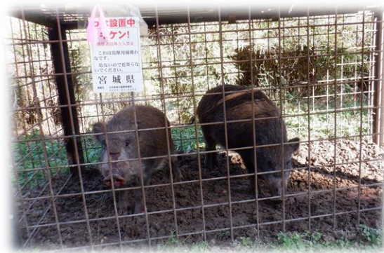
箱わなで捕獲したイノシシ

の把握、網・わなへの標識の設置、銃猟での矢先の確認などのルールをしっかりと順守することが必要となります。