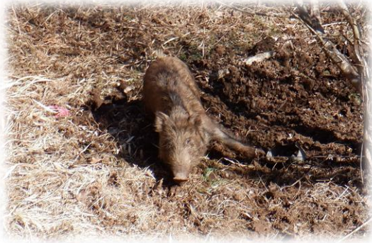
くくりわなで捕獲したイノシシ

そのほかにも、安全で適正な狩猟をするためには様々なルールが定められており、狩猟免許の取得、登録手続きを行うのはもちろん、狩猟可能な鳥獣