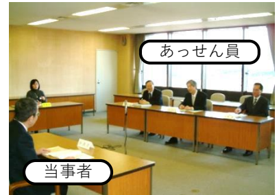
あっせんのイメージ

の三者で構成される「あっせん員」が、当事者双方から丁寧に主張等を聴き取り、労働者、使用者のどちらも納得できる解決を目指します。