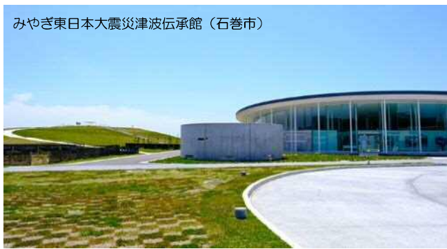
みやぎ東日本大震災津波伝承館（石巻市）