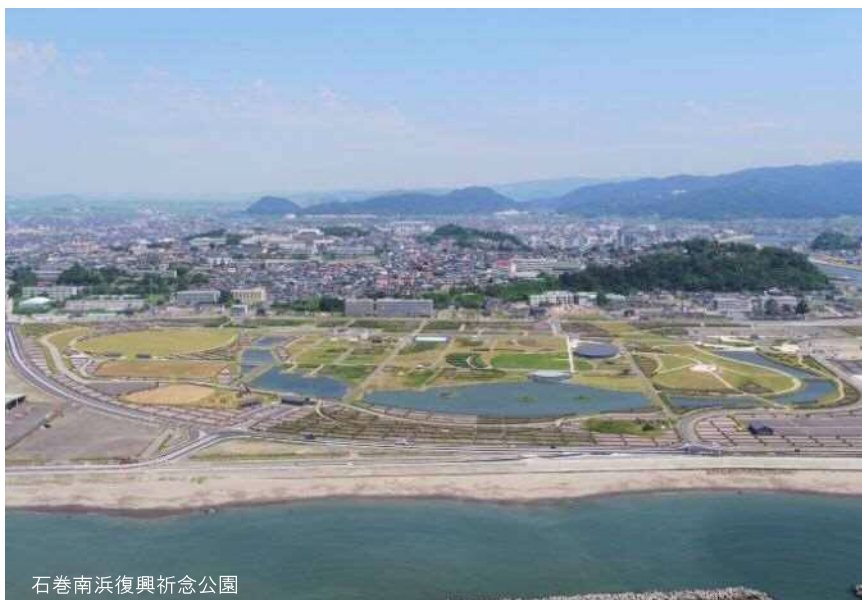
石巻南浜復興祈念公園