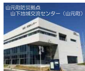
山元町防災拠点 山下地域交流センター（山元町）