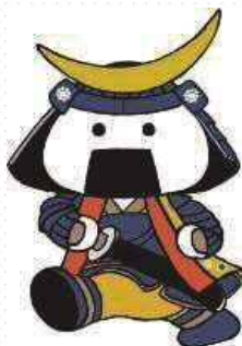
仙台・宮城観光PRキャラクター むすび丸