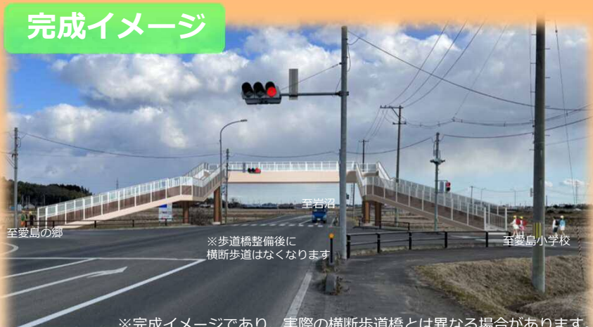
※完成イメージであり、実際の横断歩道橋とは異なる場合があります。