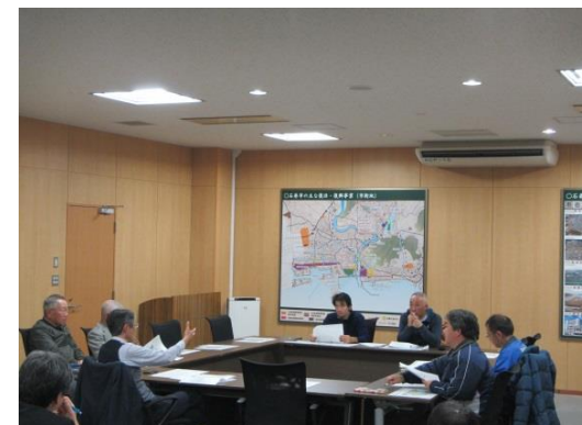
▲ 杜づくり部会開催状況

郷土種の種子採取、育苗、植樹、植栽地の除草、間伐、枝打ち、枯損木の植替え等の検討