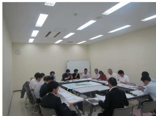
▲ 伝承部会開催状況

東日本大震災の被災の実情と後世への記憶の伝承を目的とし、語り部、震災学習ガイド、県内他地域との連携等の検討