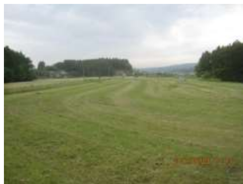
▲場内では除草作業も実施しています（6月）