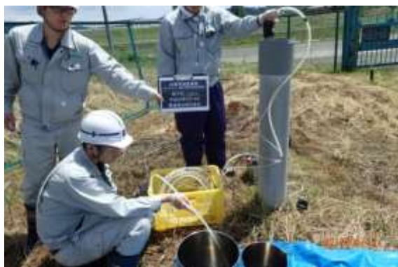
▲6月の水質調査(ダイオキシン類)試料採取作業

処分場の巡回点検を毎週2回及び随時実施して、処分場の覆土や発生ガス処理施設等の点検を行い、処分場を適切な維持管理に努めています。