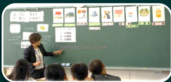
パネルを使って身の回りの税を考える

東京書籍 第6学年 新しい社会(政治・国際編)の 「税金の働き」に『出前授業』が紹介されています!