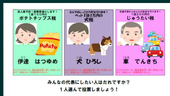
模擬選挙を通して、税と選挙を考える