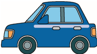
消費者庁イラスト集より