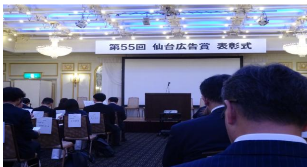
メディアを活用した消費者被害対策広報で