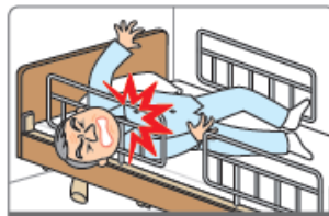
サイドレール内のすき間