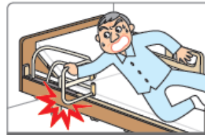
未固定による転倒・骨折