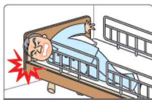
ボードとサイドレールのすき間