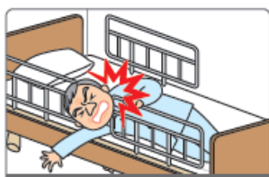
サイドレールとサイドレールのすき間

今すぐ確認と対策をしましょう！！まずは製造メーカーや福祉用具貸与事業者にお問い合わせください。