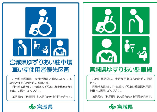
(対象区画であることを示すステッカー)