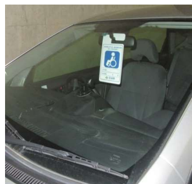
(利用証掲示のイメージ)