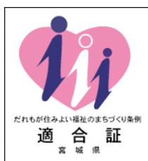
みやぎけんてきごう 宮城県適合マーク