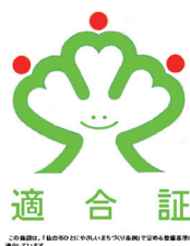
せんだいしてきごう 仙台市適合マーク

これらのマークは、 こうれい 高齢の人や ひと 障害のある人だけでなく、 「だれもが りよう 利用しやすい しせつ 施設」であることを知らせるマークです。