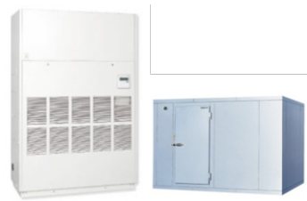
温度管理を要する装置・設備の導入