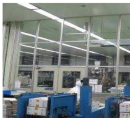
空気を経由した汚染の防止設備 (パーティション)の導入

施設整備と一体となってその効果を一層高めるために必要な費用(コンサルティング費用等)