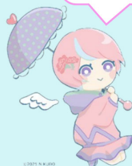
川内沢ダムイメージキャラクター「川内あい」