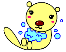
仙南保健所オリジナルキャラクター「てあらっこ」

仙台市保健所管内で定点当たりのインフルエンザ報告数が注意報発表基準を上回ったため、 宮城県では、9月14日にインフルエンザ注意報を発表しました。 咳やくしゃみ等の症状がある場合は、周囲への感染防止のため、咳エチケットの御協力をお願いします。