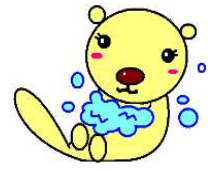
仙南保健所オリジナルキャラクター「てあらっこ」