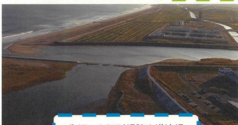
復旧した河川堤防や導流堤