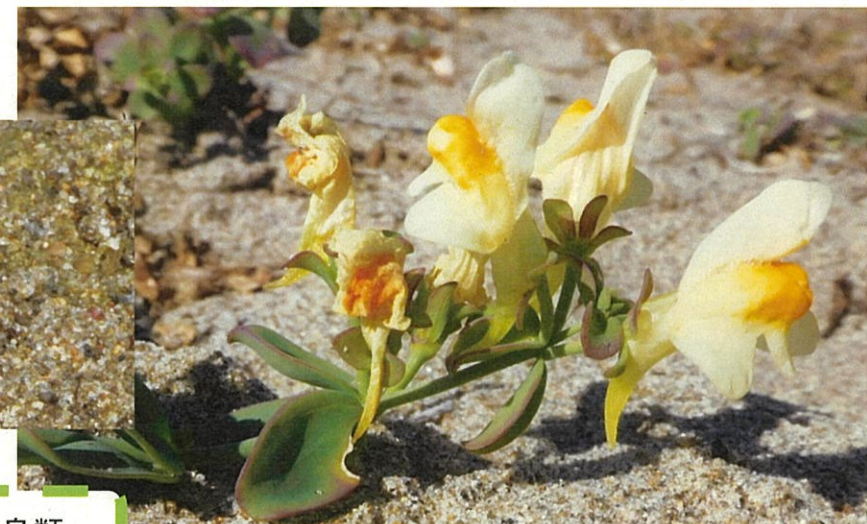
自然の力で徐々に回復した植生や底生生物と鳥類