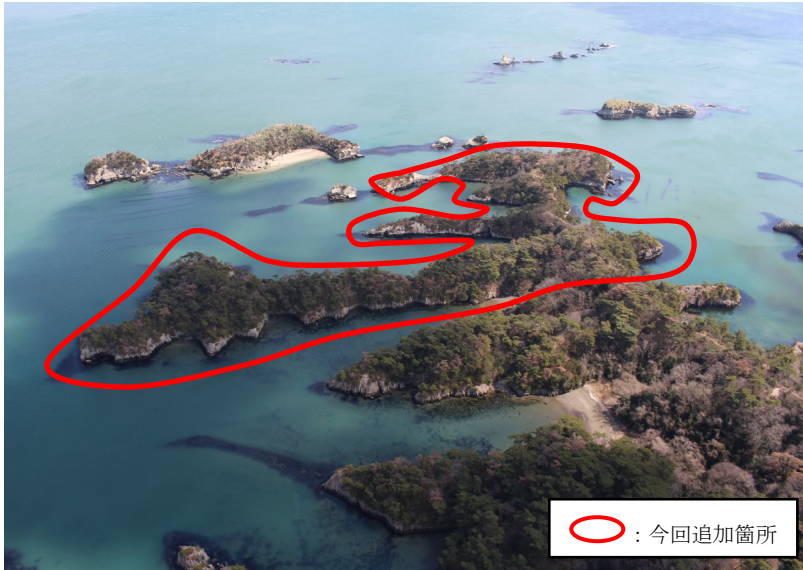
① 遠景（上空からの現況）