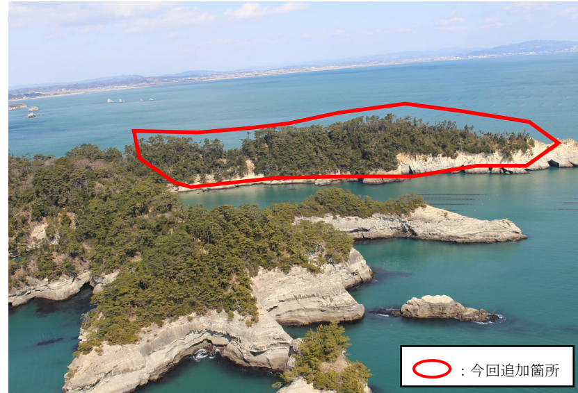
② 遠景（上空からの現況）