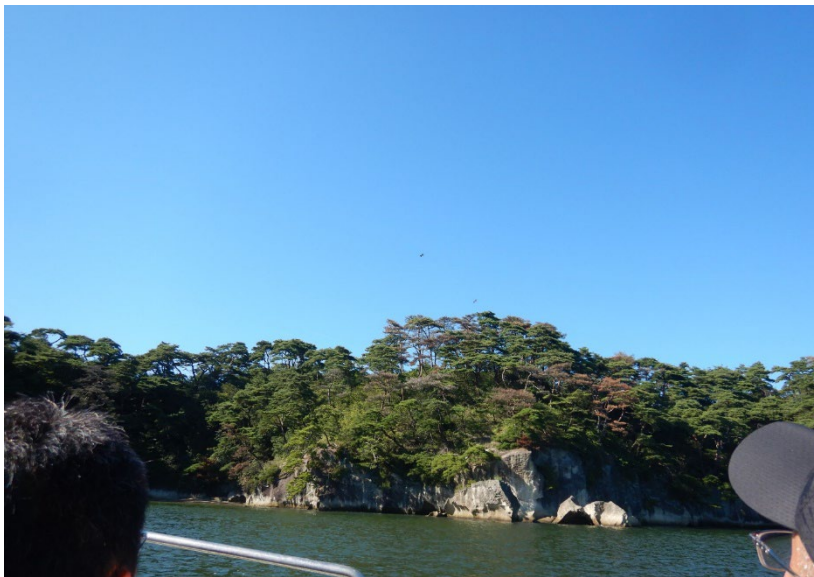
① 近景（船からの現況）