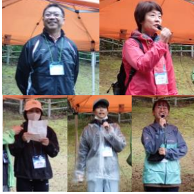
坂元小・塩田西小の校長の挨拶。 児童・学生代表の言葉。

2023年11月5日（日）WS①種子の採取、⑨苗木の植栽（坂元小・塩田西小・セキスイハイム・長野大）