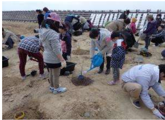
親子による植栽の様子