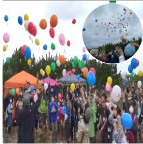
せーの、たねぷろじえくと！ 願い事が叶いますように！