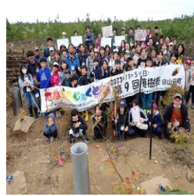
コナラの苗木20本を植栽。 71名全員で集合写真！