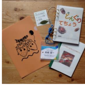
どんぐり手帳、紙芝居、名札、 クリアファイルを配布。