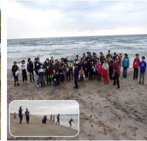
海岸散策ツアー。海遊び。 また来年、会いましょう！