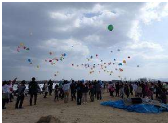
植栽終了後のイベント風景