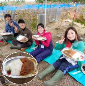
昼食。定番の「カツカレー」を 美味しくいただきました。