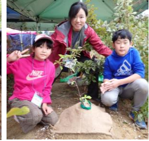
土壌改良材（42ℓ）を使って、 苗木を丁寧に植栽！