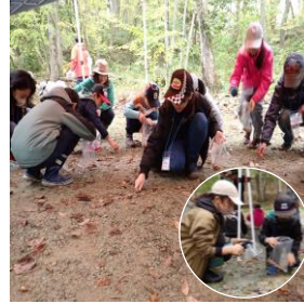
コナラのどんぐりをたくさん 拾いました。