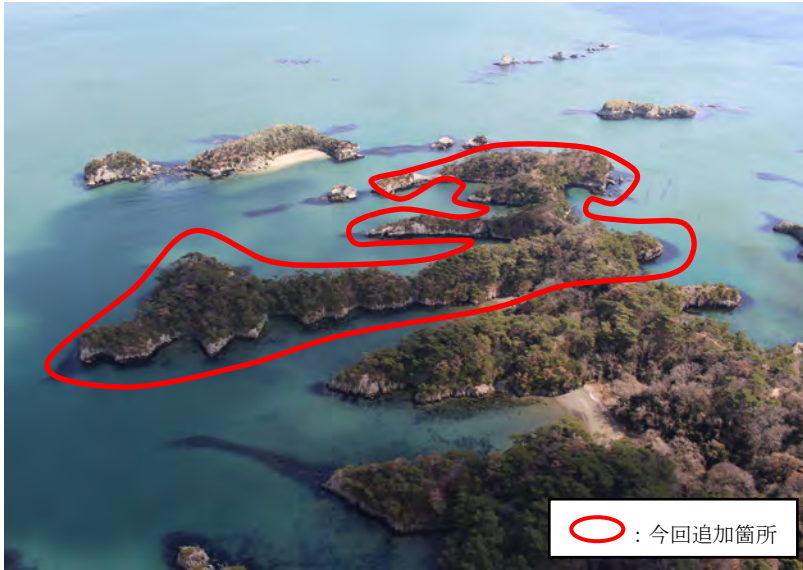
① 遠景（上空からの現況）