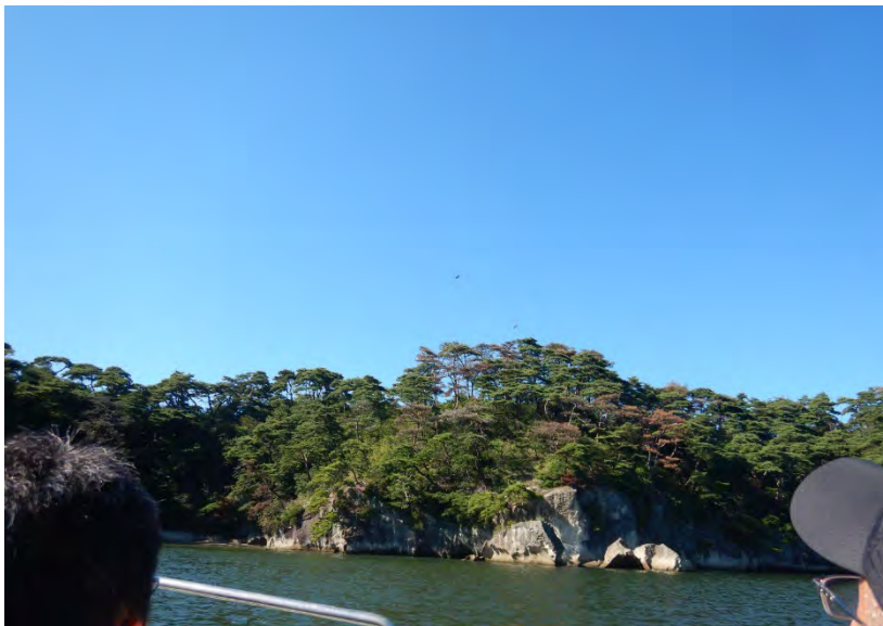
① 近景（船からの現況）