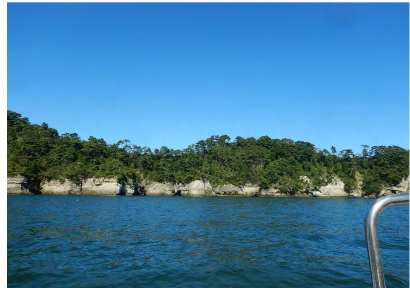
② 近景（船からの現況）