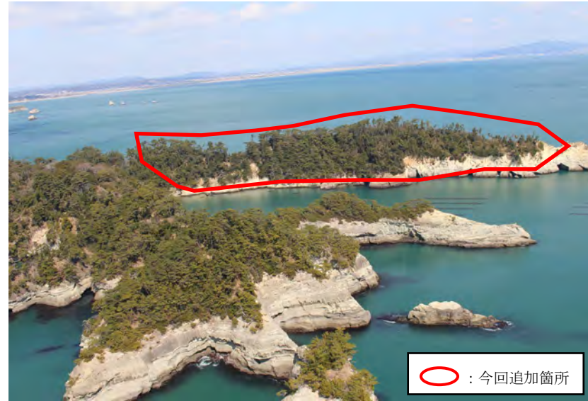
② 遠景（上空からの現況）