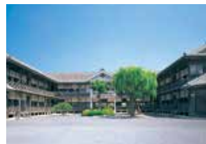
教育資料館(登米市)