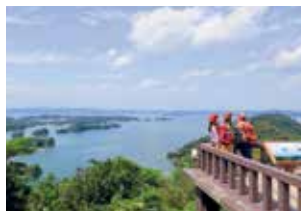
奥松島オルレコース(東松島市)