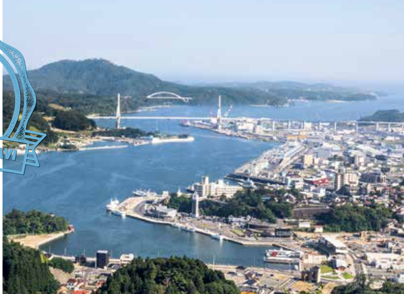
気仙沼湾(気仙沼市)