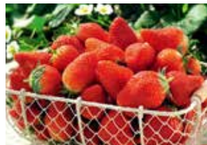
亶理いちご(亶理町)