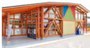
いしのまき元気いちば(石巻市)