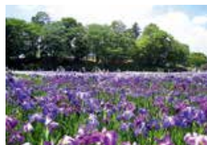
多賀城跡あやめ園(多賀城市)

仙台中心部から車で約30分圏内で行き来できる利便性の高いエリアなので、自分に合う風土、暮らしの条件に合う住環境を見つけてください。