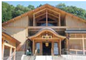
遠刈田温泉 神の湯(蔵王町)

各自治体では、子育てや住まいの支援も充実しており、移住相談窓口も設けられていますので、ぜひ、県南エリアで自分らしい移住先を見つけてください。