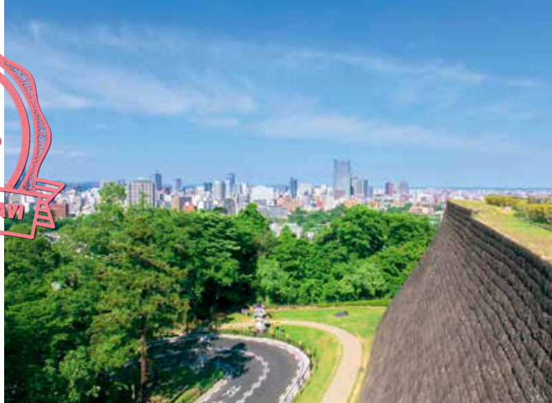
仙台城跡からの眺め(仙台市)