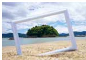
袖浜海岸(南三陸町)

※「オルレ」とはその土地の自然・歴史・文化などを身近に感じながらマイペースで楽しむトレッキングです。