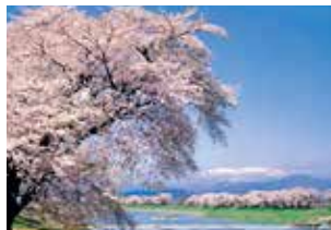
白石川堤一目千本桜(大河原町・柴田町)