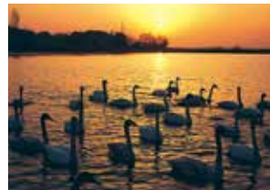
伊豆沼の白鳥(登米市・栗原市)