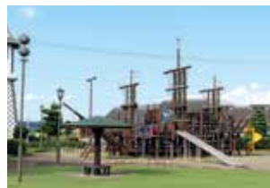
郷郷ランド(大郷町)