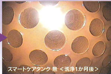
スマートケアタンク 無 <洗浄1か月後>