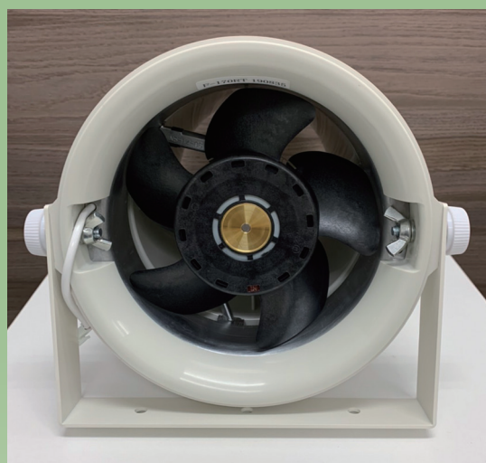
吸い込みスペーサー