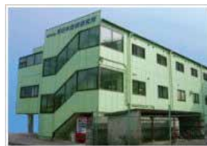
本社(茨城県日立市)