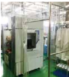
クリーンブース完備