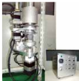
C1ロボット(信頼性向上&延命化)