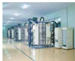
大型真空成膜装置

・フラットパネルディスプレイ用基板 (液晶ディスプレイ用、EL用、タッチパネル用) ・光学機器用部品 ・その他真空成膜製品の製造及び販売 ・測定サービス 他