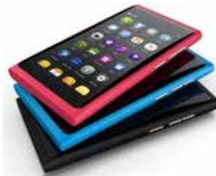
スマートフォン(透明導電膜)