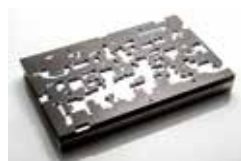
バックアップ治具