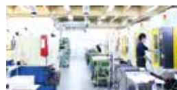
那須センター(工場)