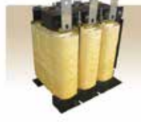
パソコン用リアクトル